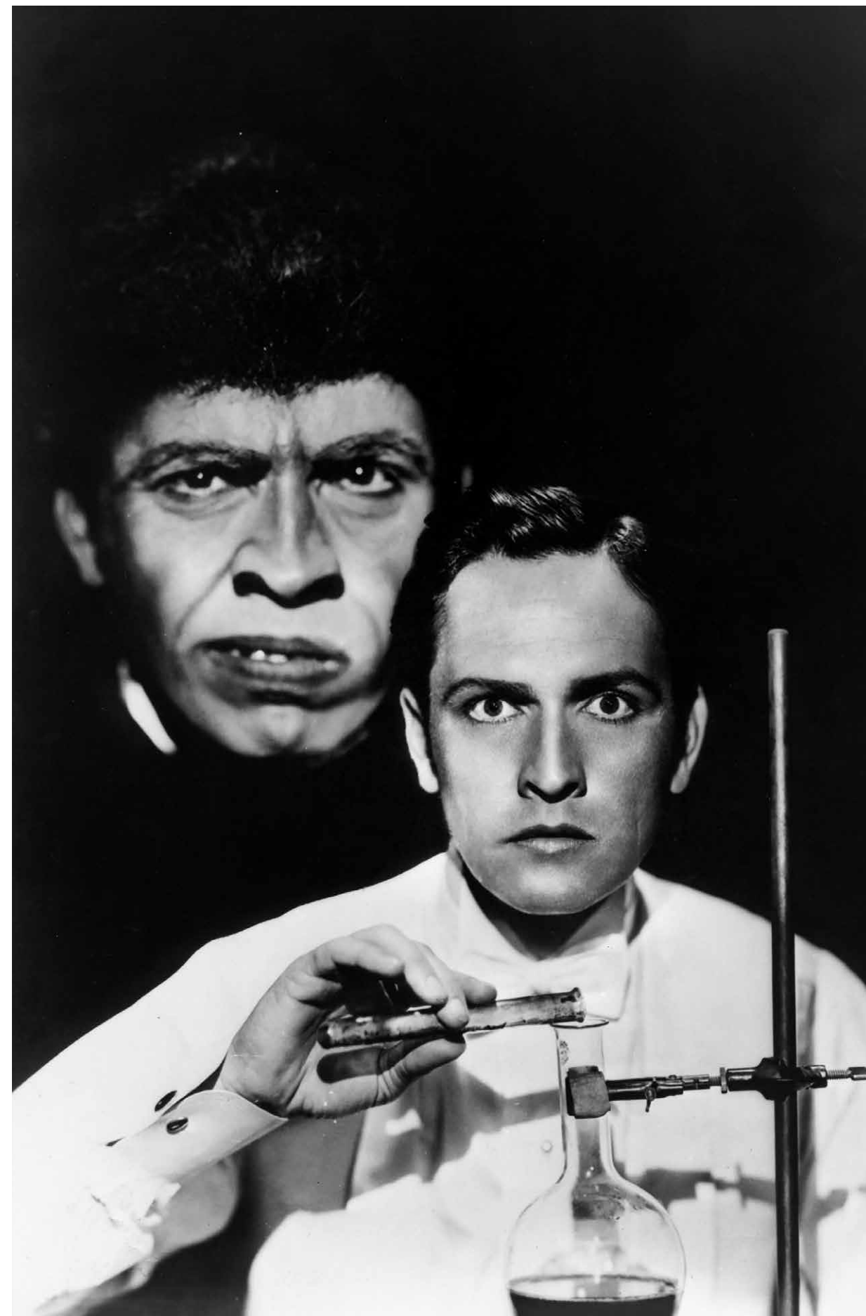
DR. JEKYLL AND MR. HYDE / S.16

Treffpunkt: Foyer Kunsthalle Basel Kosten: 15.- CHF Weitere Informationen auf www.kunsthallebasel.ch