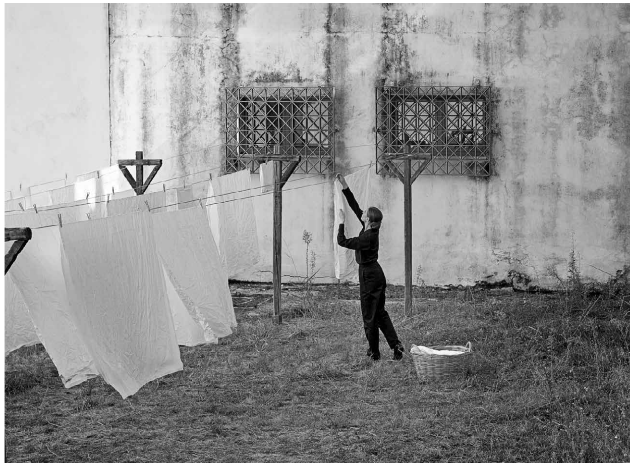
MUSIC / S.29

LANDKINO IM SPUTNIK 20:15 SPOOKTOBER YOUNG FRANKENSTEIN S.39 USA 1974 106 Min. sw. DCP. E/d MEL BROOKS