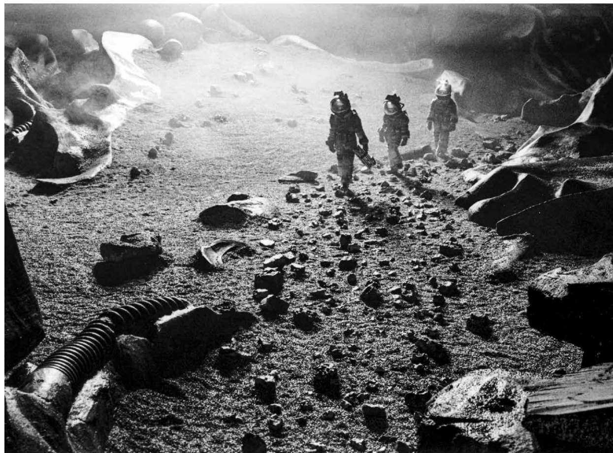
ALIEN / S.17