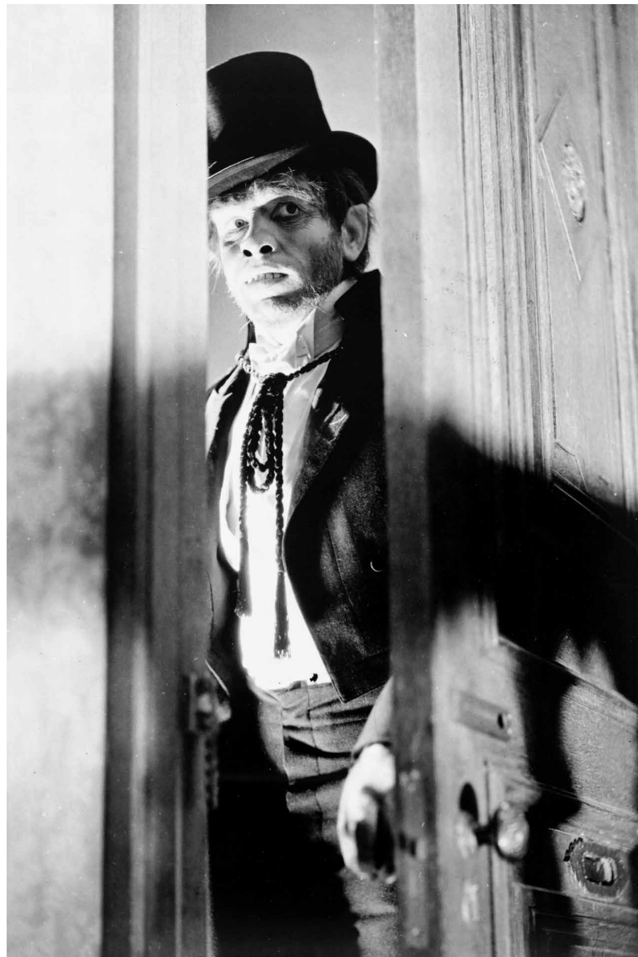
DR. JEKYLL AND MR. HYDE / S.16

LANDKINO IM SPUTNIK 20:15 SPOOKTOBER ALIEN S.39 GB, USA 1979 117 Min. Farbe. DCP E/d RIDLEY SCOTT