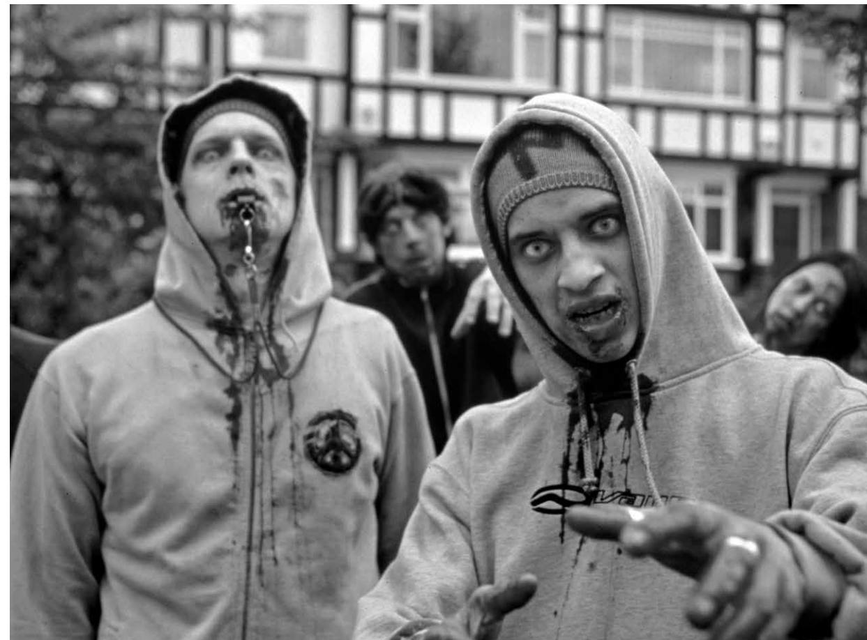
SHAUN OF THE DEAD / S.19