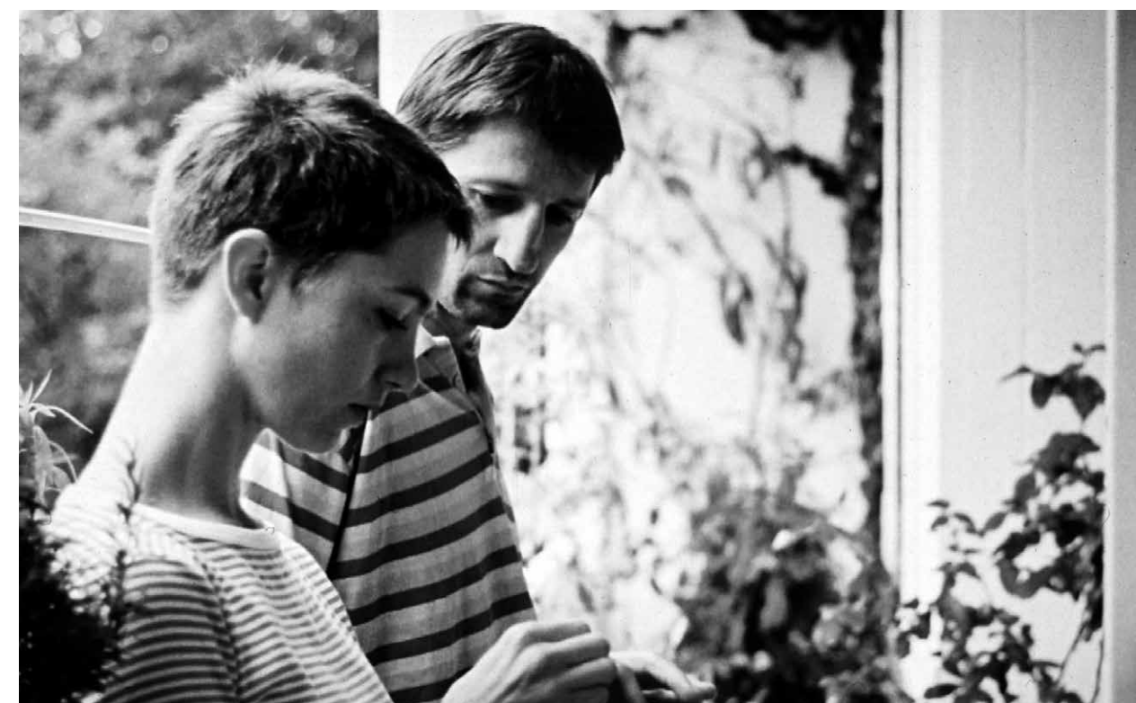
MEIN LANGSAMES LEBEN