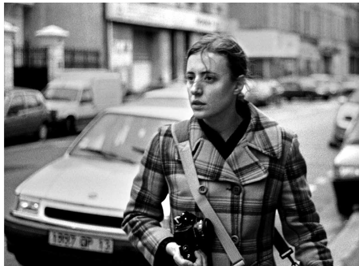
MARSEILLE / S.29

FREITAG 17:00 SPOOKTOBER CREATURE FROM THE BLACK LAGOON S.17 USA 1954 79 Min. sw. DCP. E/d JACK ARNOLD