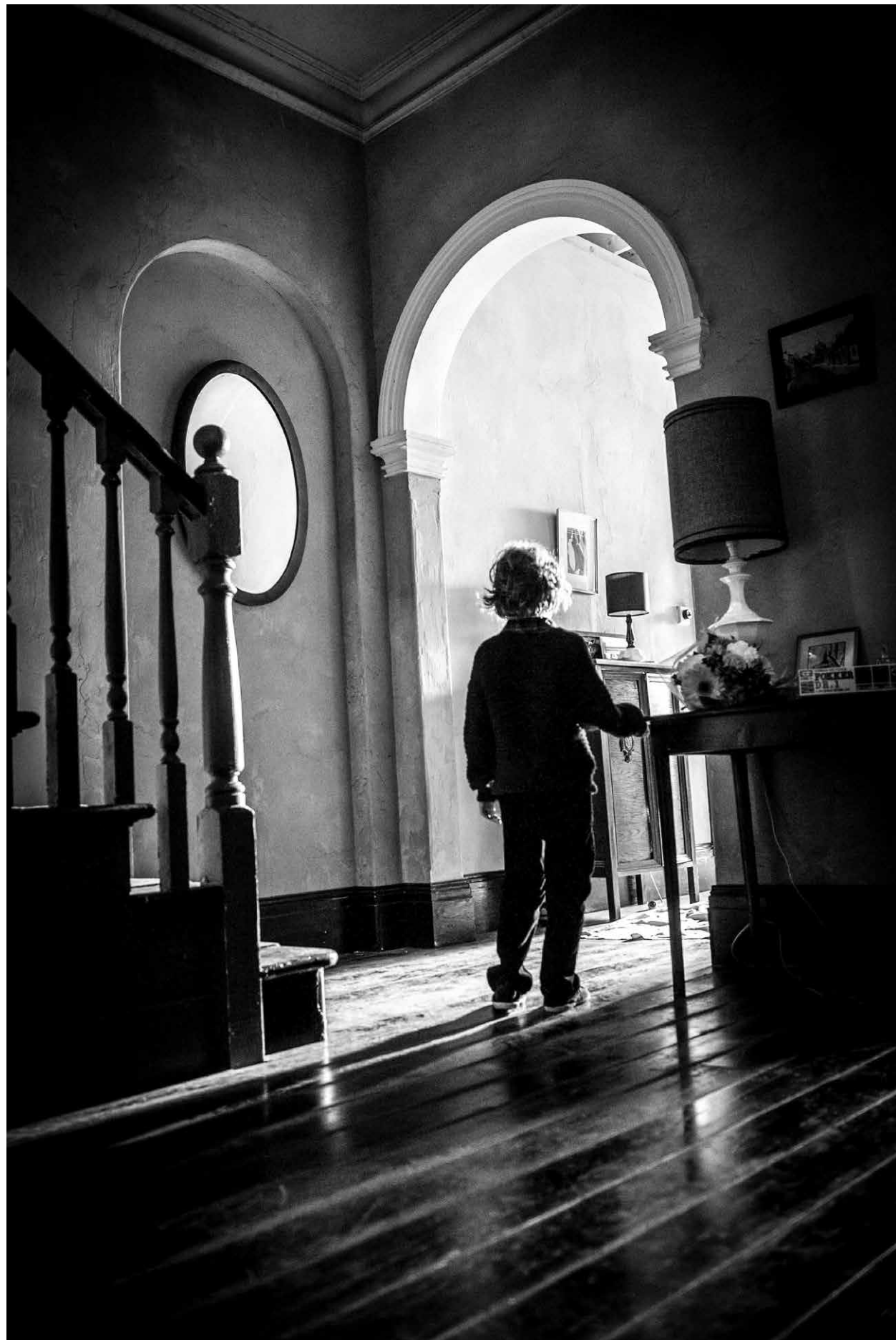
THE BABADOOK / S.20

S.39 Grossbritannien 2004 99 Min. Farbe. DCP. E/d EDGAR WRIGHT