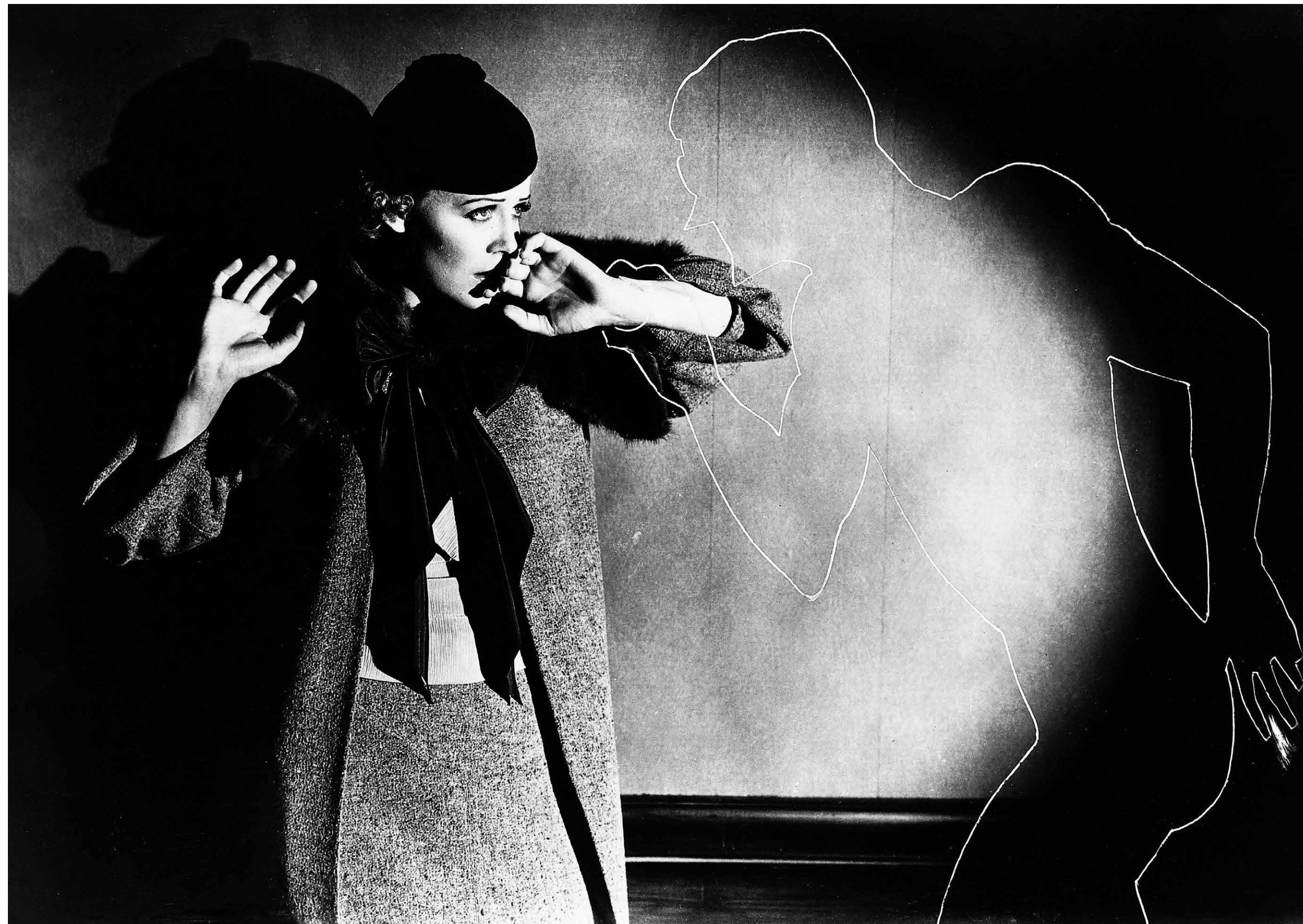
THE INVISIBLE MAN / S.16

LANDKINO IM SPUTNIK 20:15 SPOOKTOBER GREMLINS S.39 USA 1984 106 Min. Farbe. DCP. E/d JOE DANTE