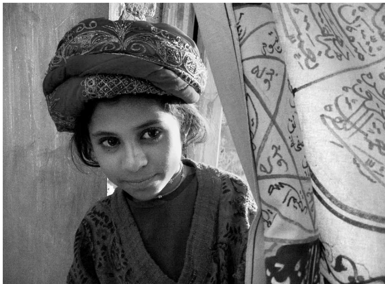
BAB'AZIZ / S.24