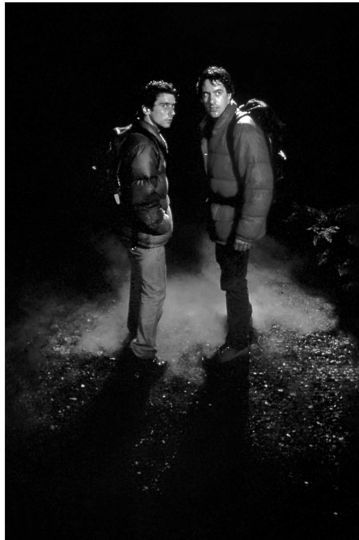
AN AMERICAN WEREWOLF IN LONDON / S.18

FREITAG 17:00 SPOOKTOBER EL ESPINAZO DEL DIABLO S.18 Spanien, Mexiko 2001 106 Min. Farbe. 35 mm. Sp/d/f GUILLERMO DEL TORO