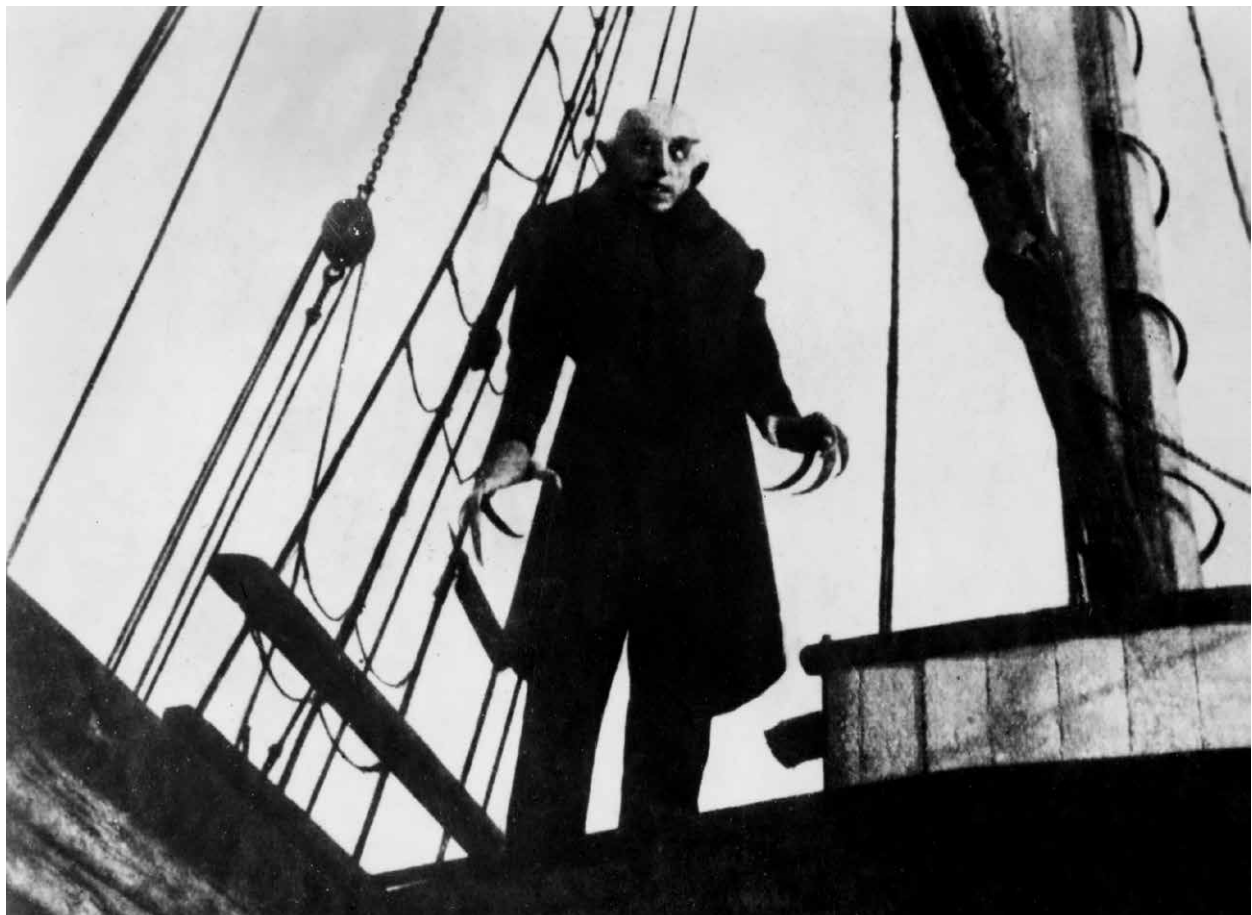
NOSFERATU – EINE SYMPHONIE DES GRAUENS / S.16