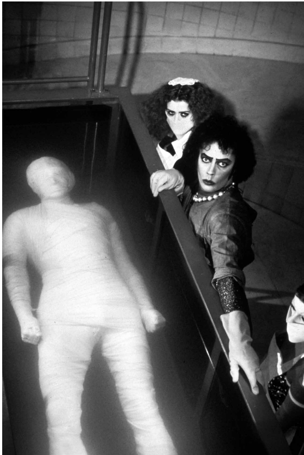
THE ROCKY HORROR PICTURE SHOW / S.17

20:30 UKRAINE PREMIERE: WE WILL NOT FADE AWAY S.37 UA, PL, FR 2023 100 Min. Farbe. DCP. OV/e ALISA KOVALENKO