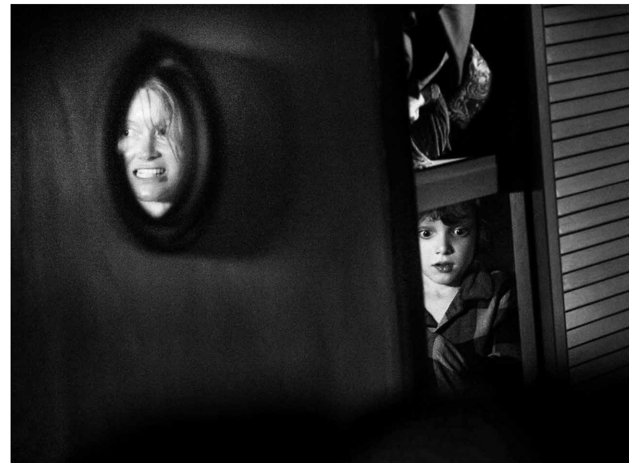
THE BABADOOK / S.20