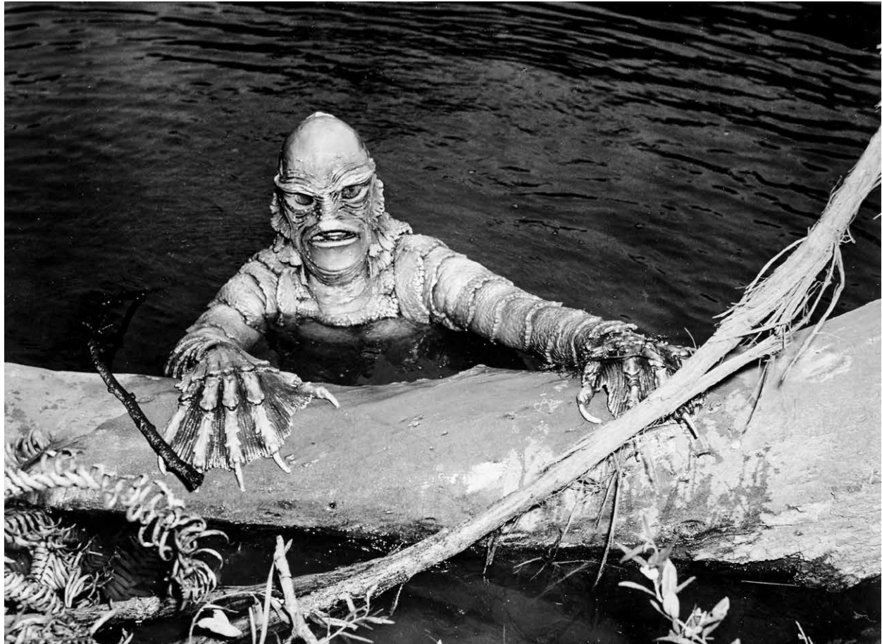
CREATURE FROM THE BLACK LAGOON / S.17