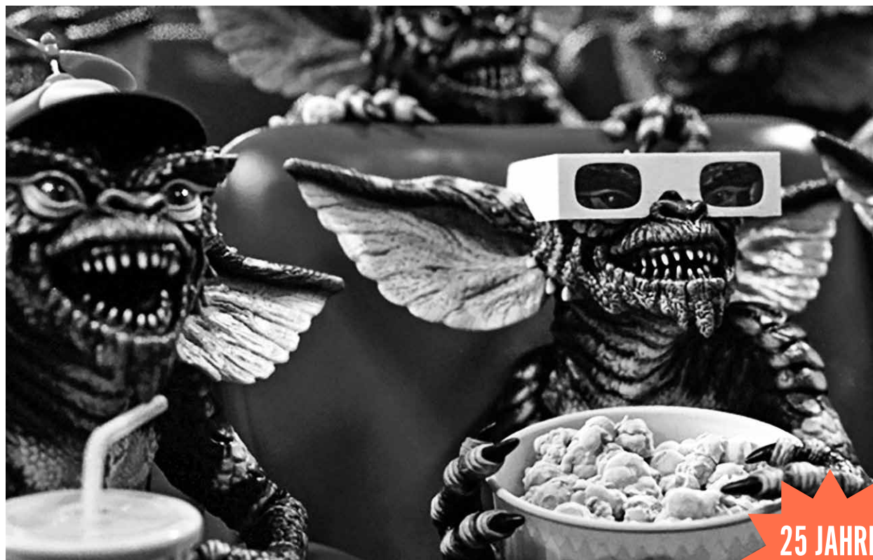
GREMLINS / S.18