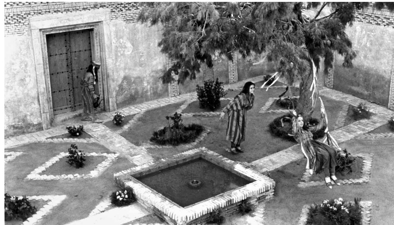
DAS VERLORENE HALSBAND DER TAUBE

«Mit einfachen Mitteln konstruiert der tunesische Filmemacher Nacer Khemir eine Geschichte, die Vergangenheit, Gegenwart und Zukunft miteinander verwebt und die Poesie und den spirituellen Reichtum des Sufismus offenbart.» Lumiere.nl