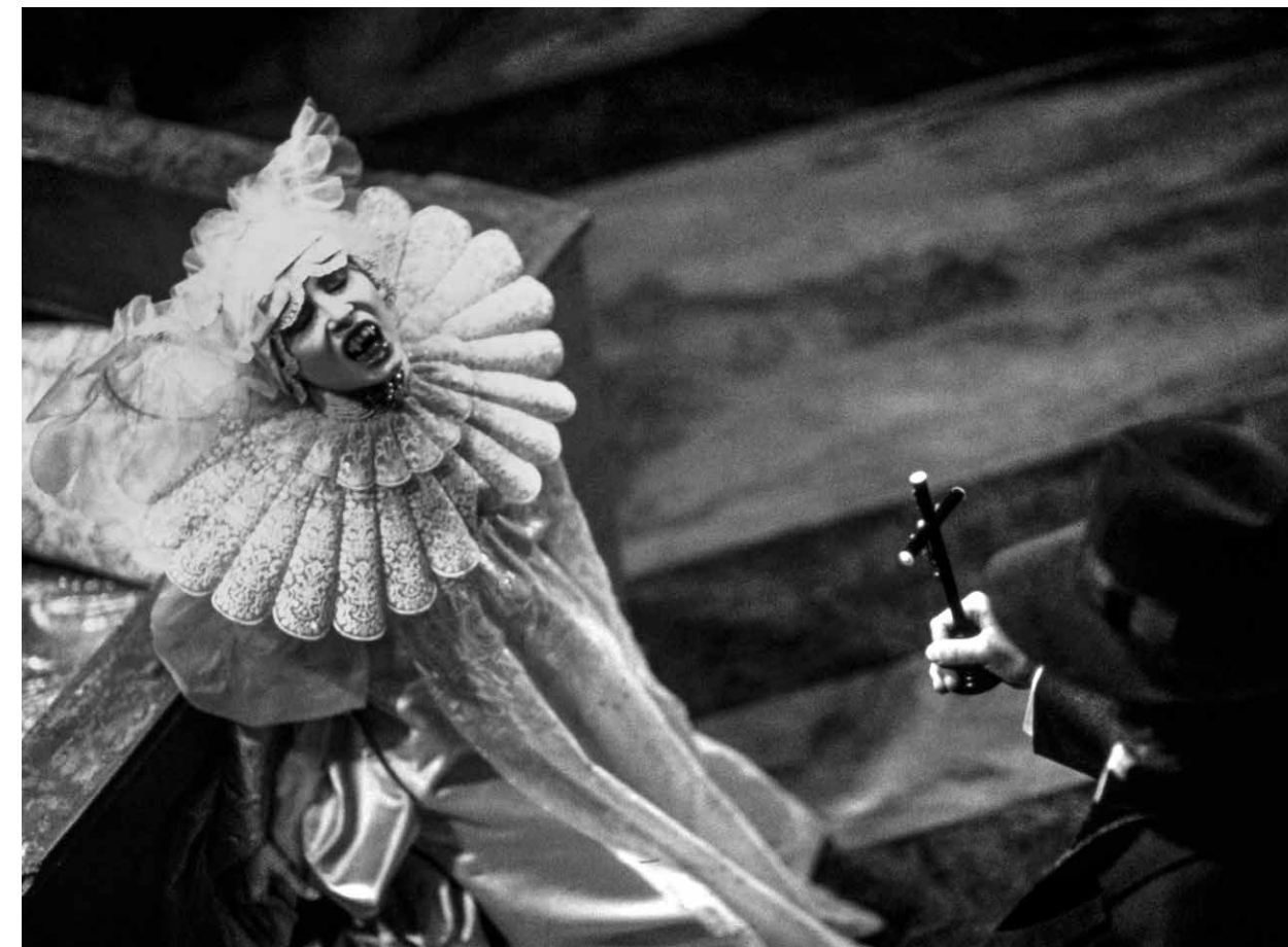
BRAM STOKER'S DRACULA / S.18

FREITAG 17:00 3 SPOOKTOBER THE BLOB S.17 USA 1958 86 Min. Farbe. DCP E/d IRVIN S. YEAWORTH JR., RUSSELL S. DOUGHTEN JR.