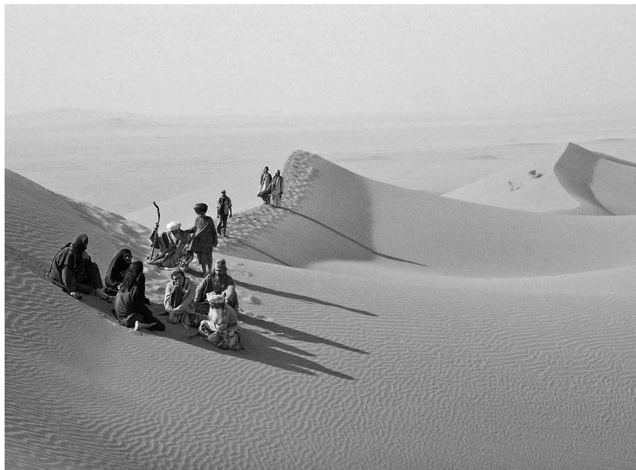
BAB'AZIZ / S.24

LANDKINO IM FACHWERK 19:30 Bildrausch und Luststreifen präsentieren: ORLANDO, MY POLITICAL BIOGRAPHY S.39 Frankreich 2023 98 Min. Farbe. DCP. F/d PAUL B. PRECIADO