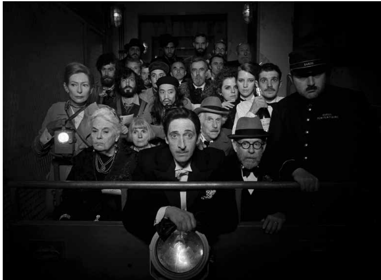
THE FRENCH DISPATCH / S.18