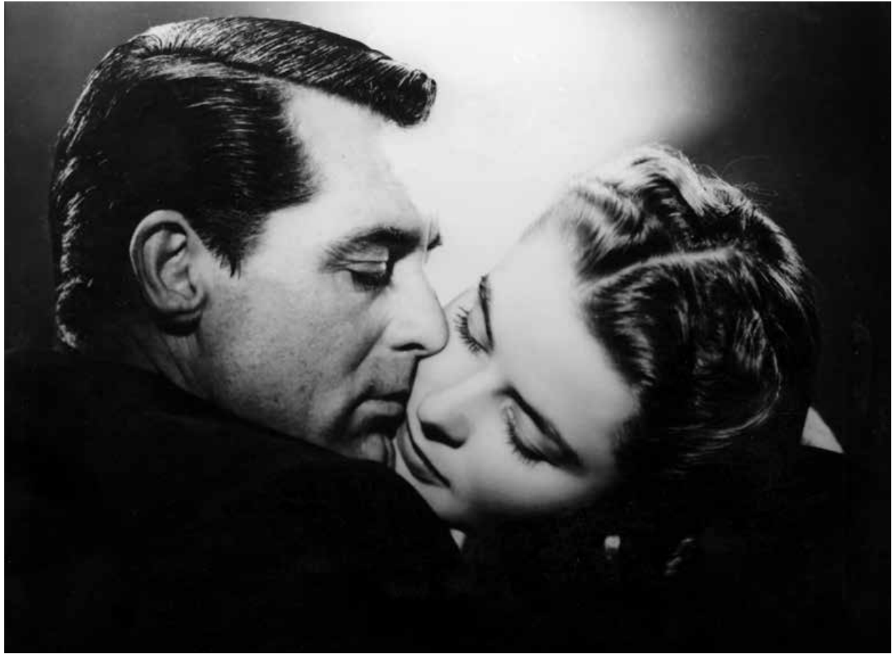
NOTORIOUS / S.23

FREITAG 19:00 WOMEN IN FILM NOIR DOUBLE INDEMNITY S.22 USA 1944 107 Min. sw. DCP. E/d BILLY WILDER