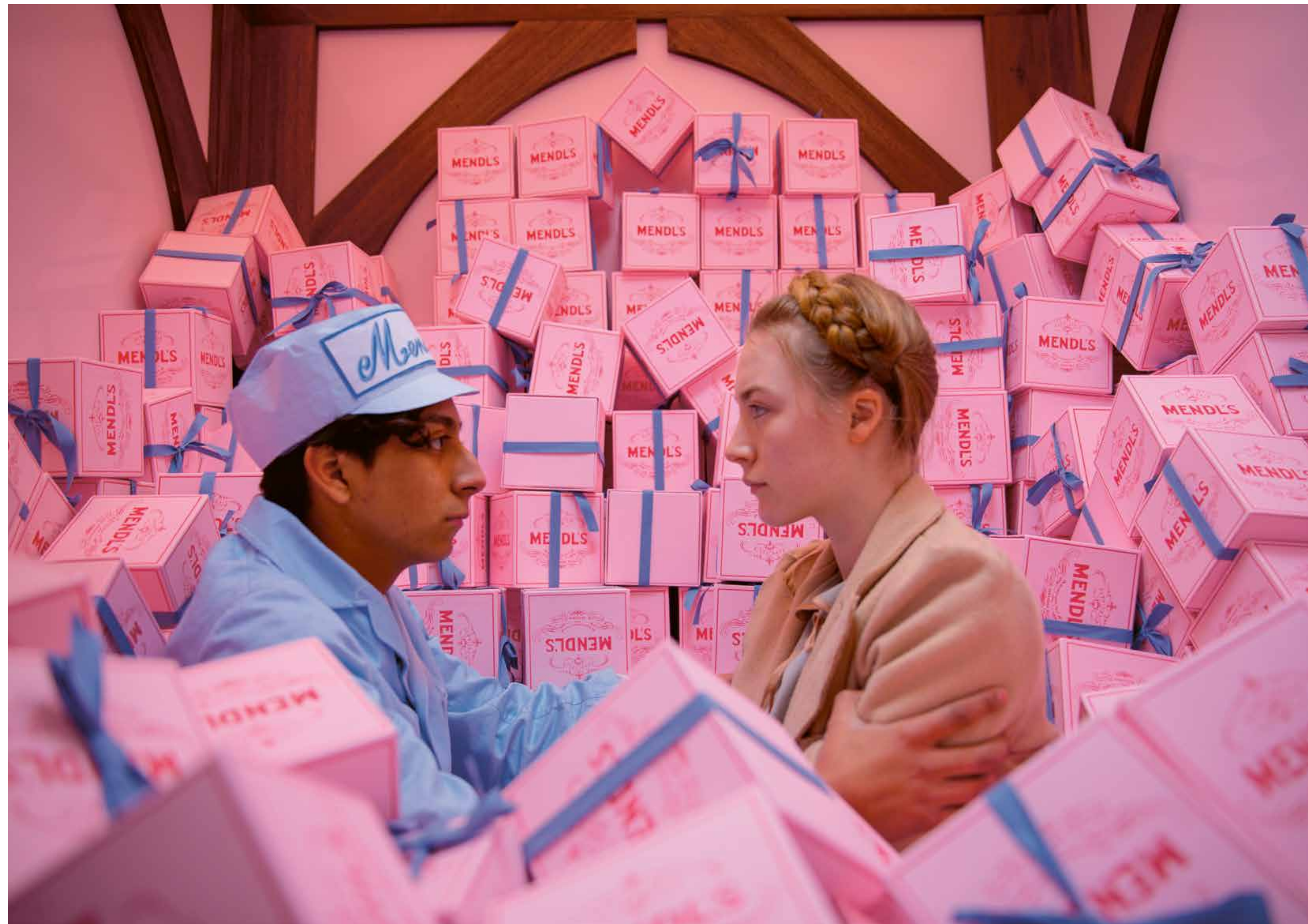
THE GRAND BUDAPEST HOTEL / S.17

LANDKINO IM FACHWERK 19:30 WES ANDERSON MOONRISE KINGDOM S.29 USA 2012 94 Min. Farbe, Digital HD, E/d WES ANDERSON