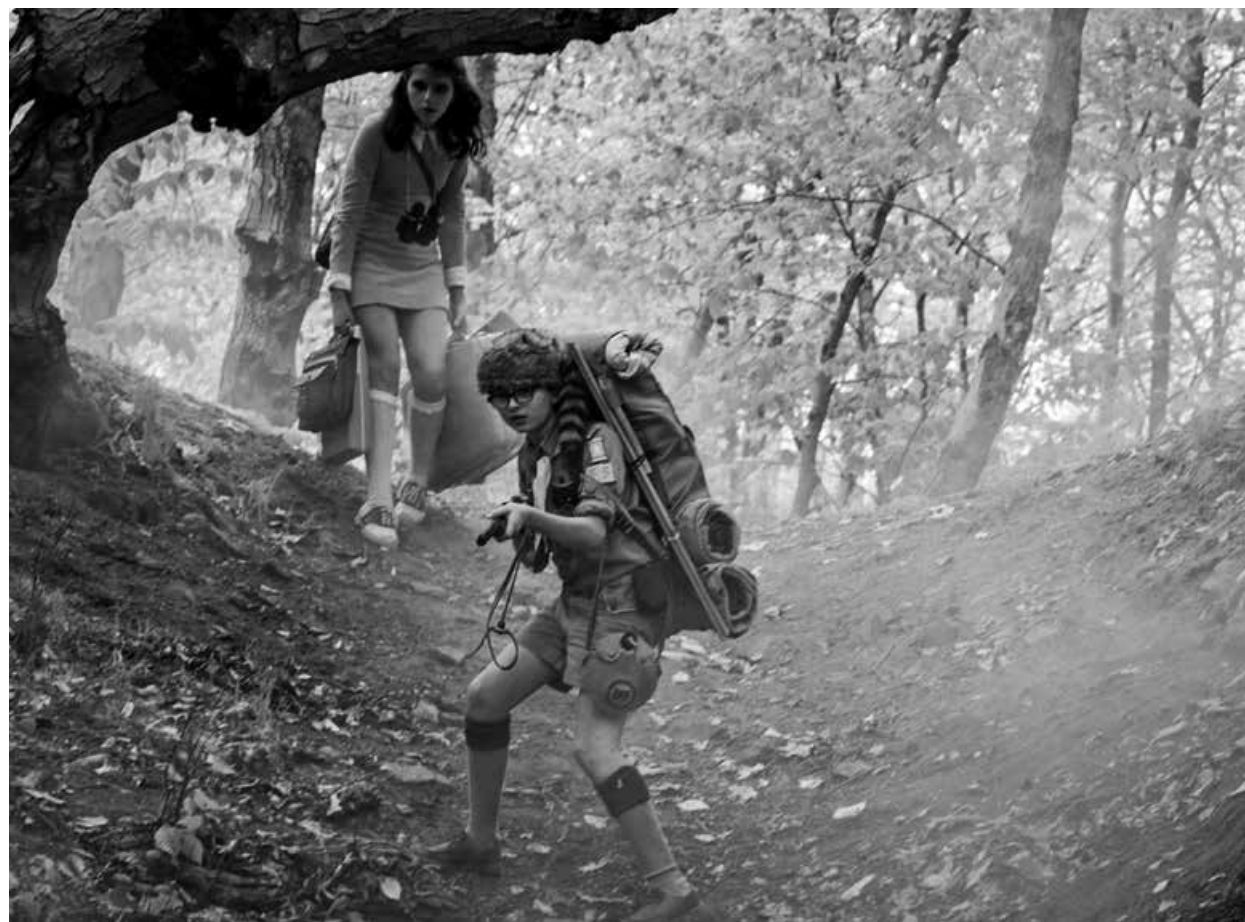
MOONRISE KINGDOM / S.17

LANDKINO IM FACHWERK 19:30 WES ANDERSON THE DARJEELING LIMITED S.29 USA, Indien 2007 91 Min. Farbe. Digital HD. E/d WES ANDERSON