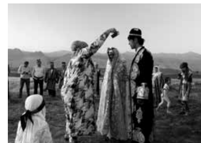
RHYTHMS OF LOST TIME

Weitere Infos auf: www.aubefilmfestival.ch