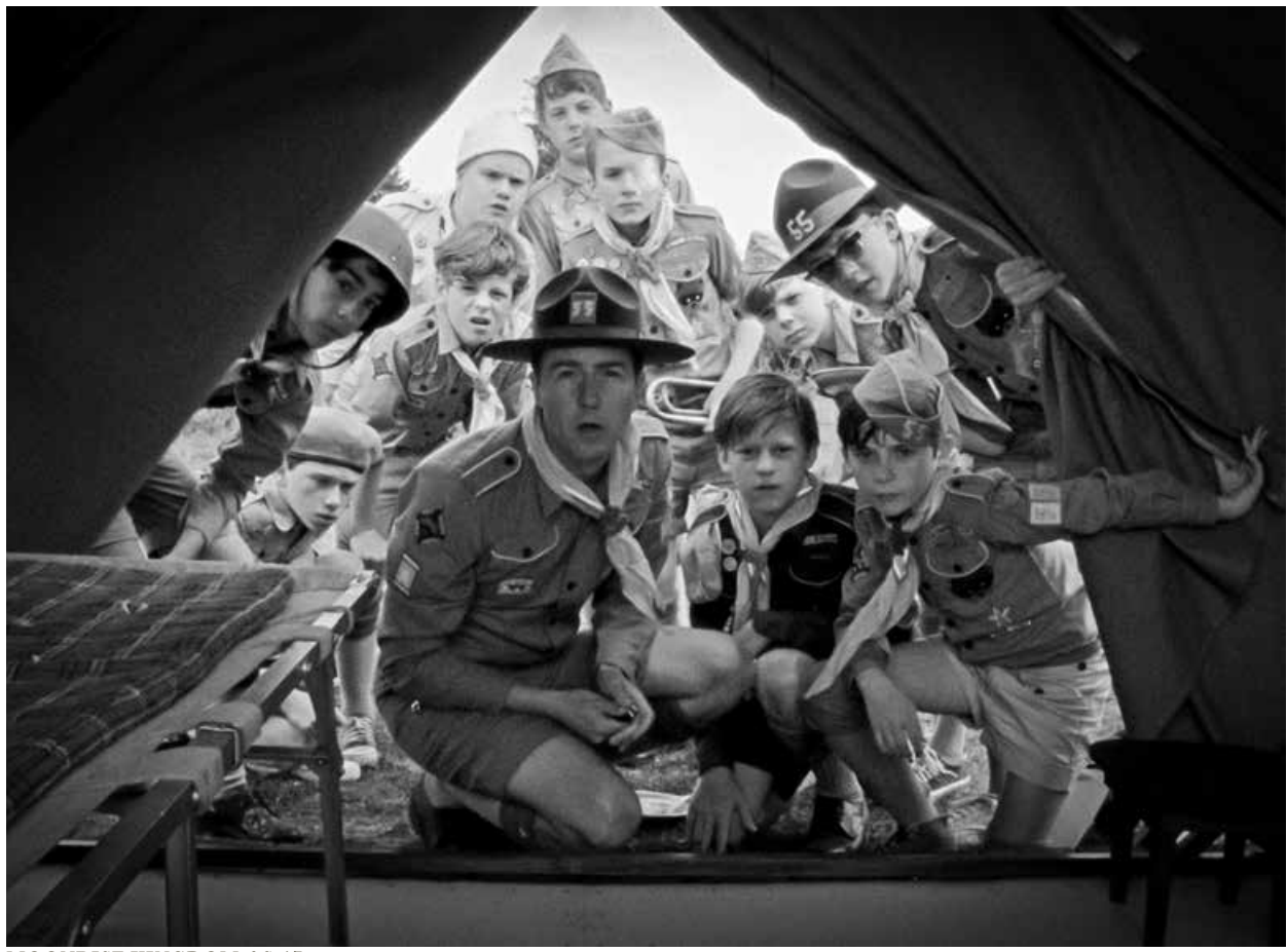
MOONRISE KINGDOM / S.17