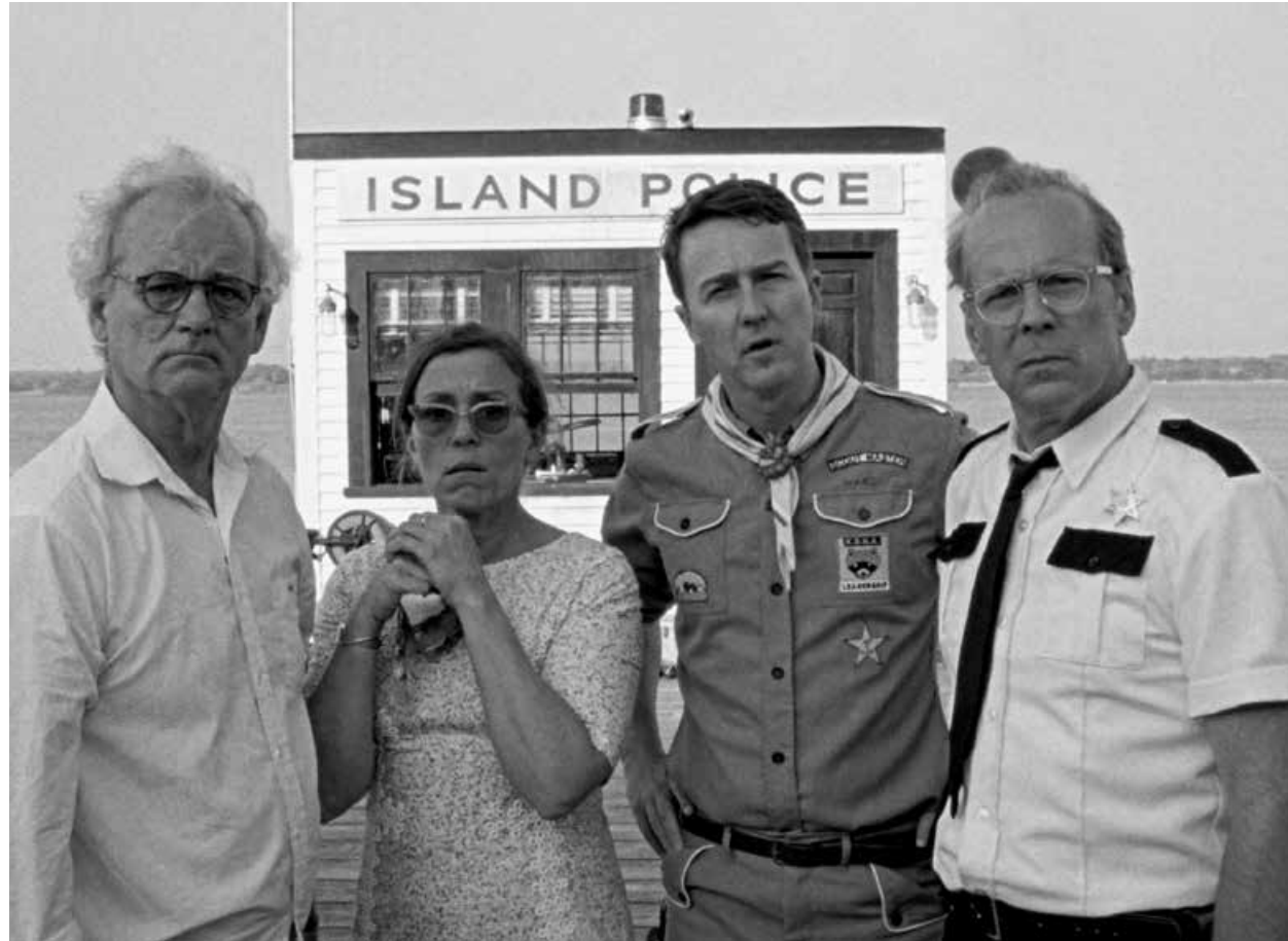
MOONRISE KINGDOM / S.17