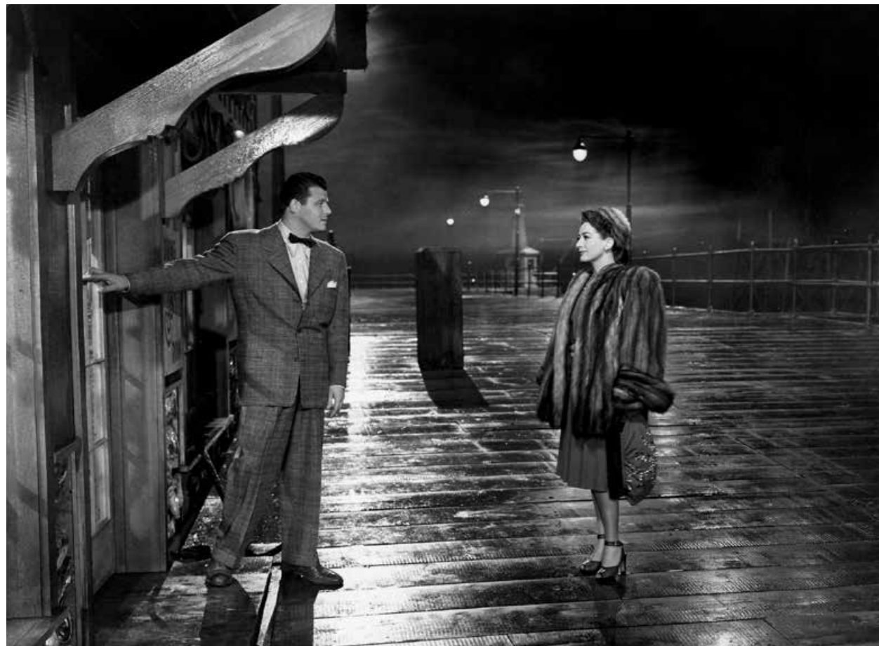
MILDRED PIERCE / S.23

DONNERSTAG 19:50 SÉLECTION LE BON FILM UNTIL BRANCHES BEND S.30 Kanada, Schweiz 2022 98 Min. Farbe. DCP. E/d/f SOPHIE JARVIS Saisonöffnung mit Film- vorführung und Gespräch mit der Regisseurin, Apéro im Anschluss. Eine Gemeinschafts- produktion mit Filmexplorer