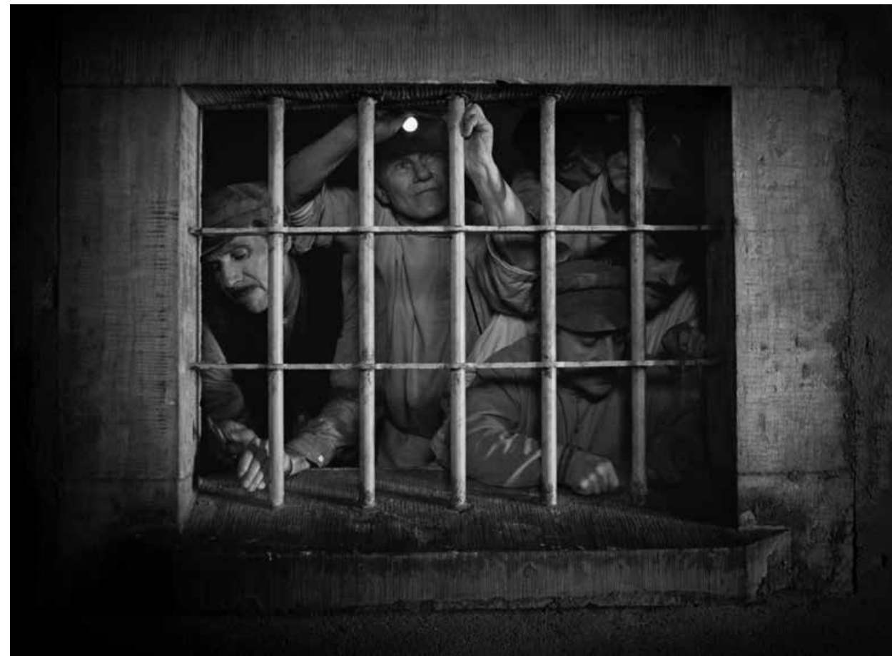
THE GRAND BUDAPEST HOTEL / S.17