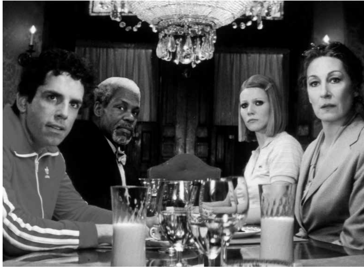
THE ROYAL TENENBAUMS / S.16