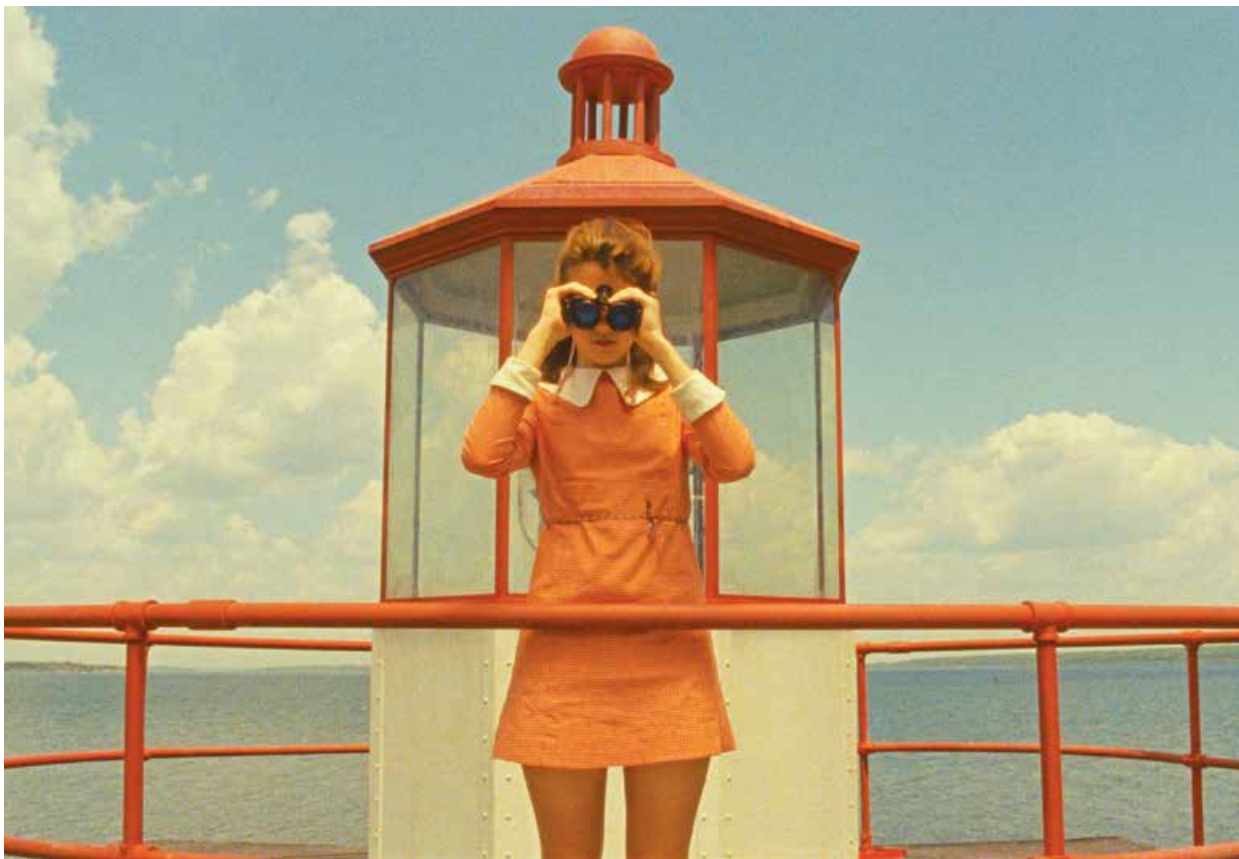
MOONRISE KINGDOM / S.17