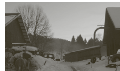
LE SAISON DE SILENCE