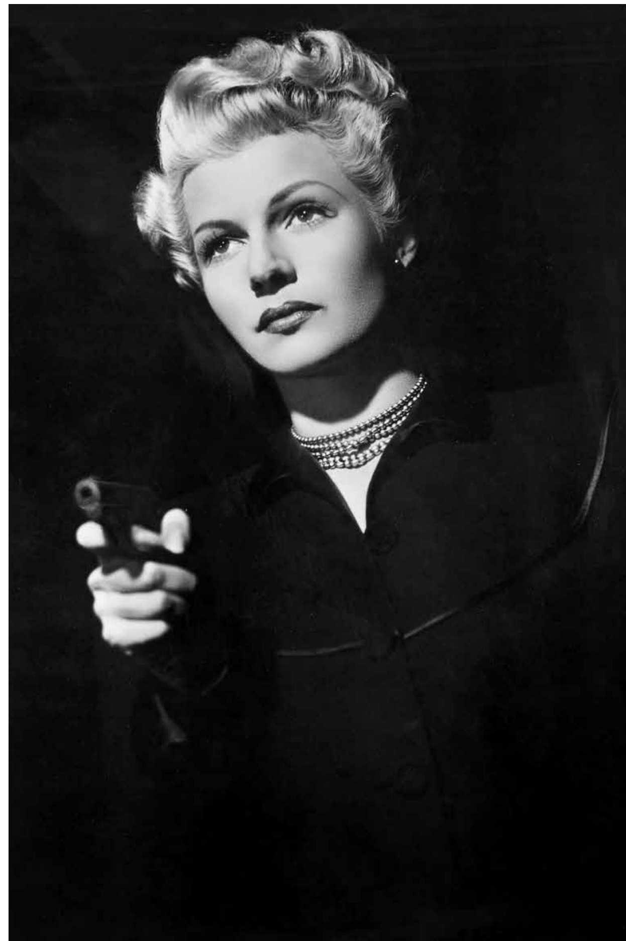
THE LADY FROM SHANGHAI / S.24

21:45 WES ANDERSON ASTEROID CITY S.18 USA 2023 104 Min. Farbe. DCP. E/d/f WES ANDERSON