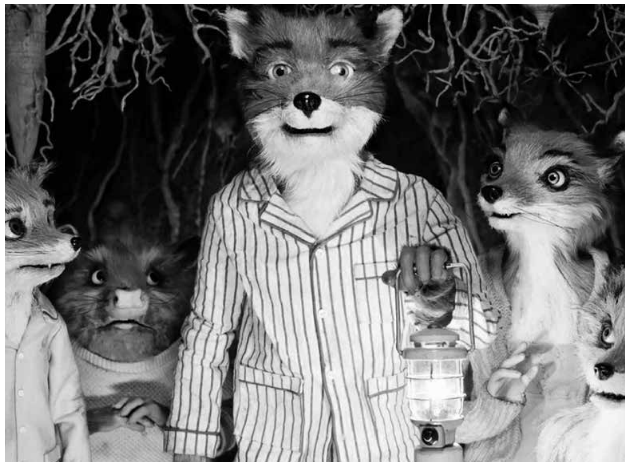
FANTASTIC MR. FOX / S.17

FREITAG 17:00 WES ANDERSON ISLE OF DOGS S.18 USA, Deutschland, GB, Japan 2018 101 Min. Farbe. Digital HD. E/d WES ANDERSON