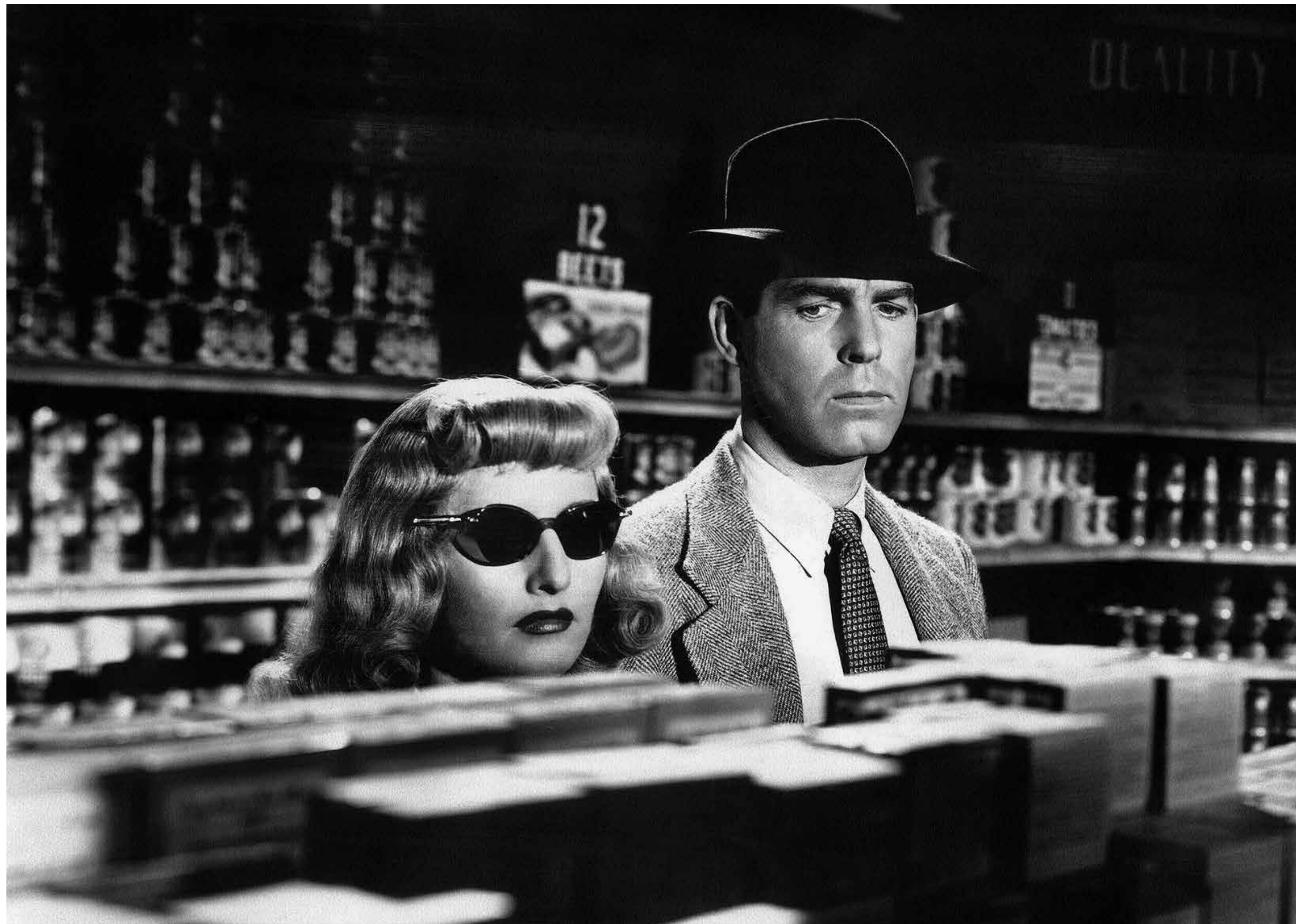
DOUBLE INDEMNITY / S.22

LANDKINO IM SPUTNIK 20:15 WES ANDERSON THE GRAND BUDAPEST HOTEL S.29 USA, Deutschland 2014 99 Min. Farbe. Digital HD. E/d WES ANDERSON