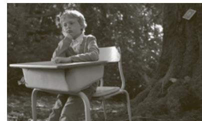
THE WORST DAY EVER

LE SAISON DE SILENCE , Tizian Büchi, Schweiz 2016, 27 Min., Farbe, Digital HD, F/e