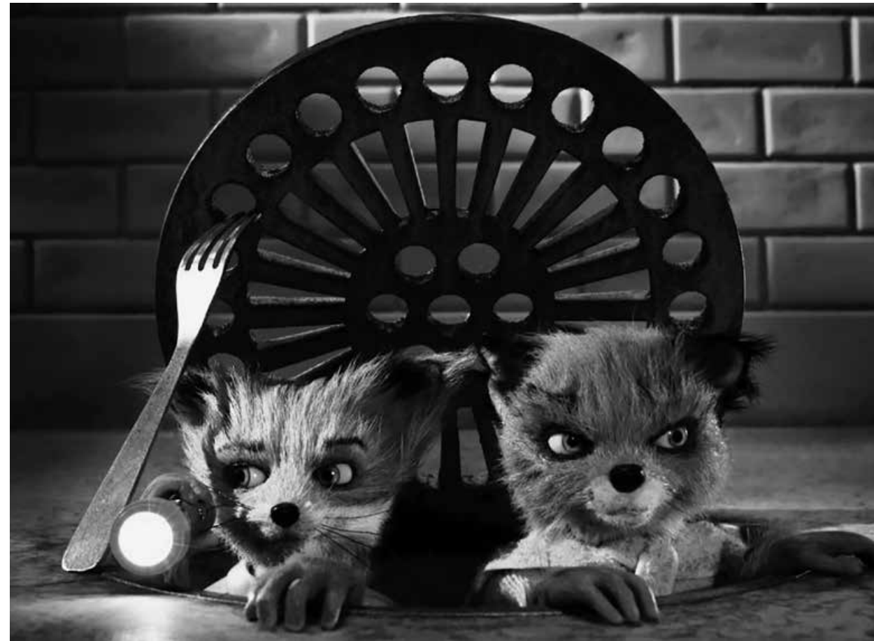
FANTASTIC MR. FOX / S.17