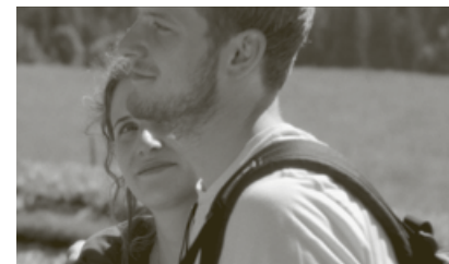
ON AVAIT DI QU'ON IRAIT JUSQU'EN HAUT