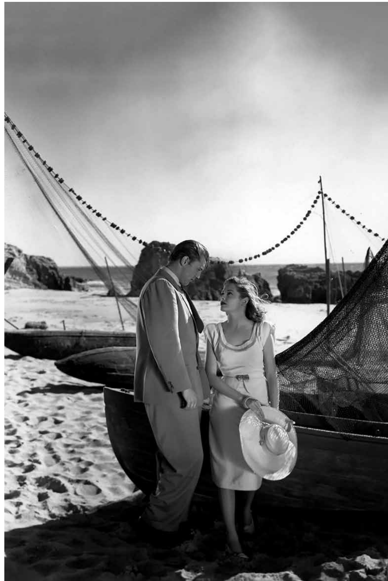
OUT OF THE PAST / S.24

FREITAG 19:15 WOMEN IN FILM NOIR SHANGHAI EXPRESS S.22 USA 1932 82 Min. sw. DCP. E/d JOSEF VON STERNBERG