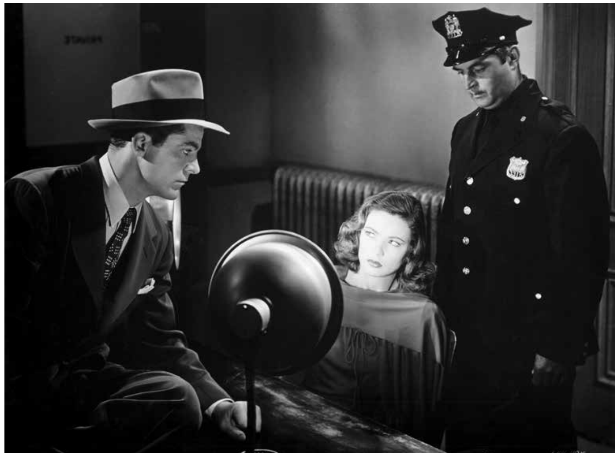
LAURA / S.23

S.29 USA 2012 94 Min. Farbe. Digital HD. E/d WES ANDERSON