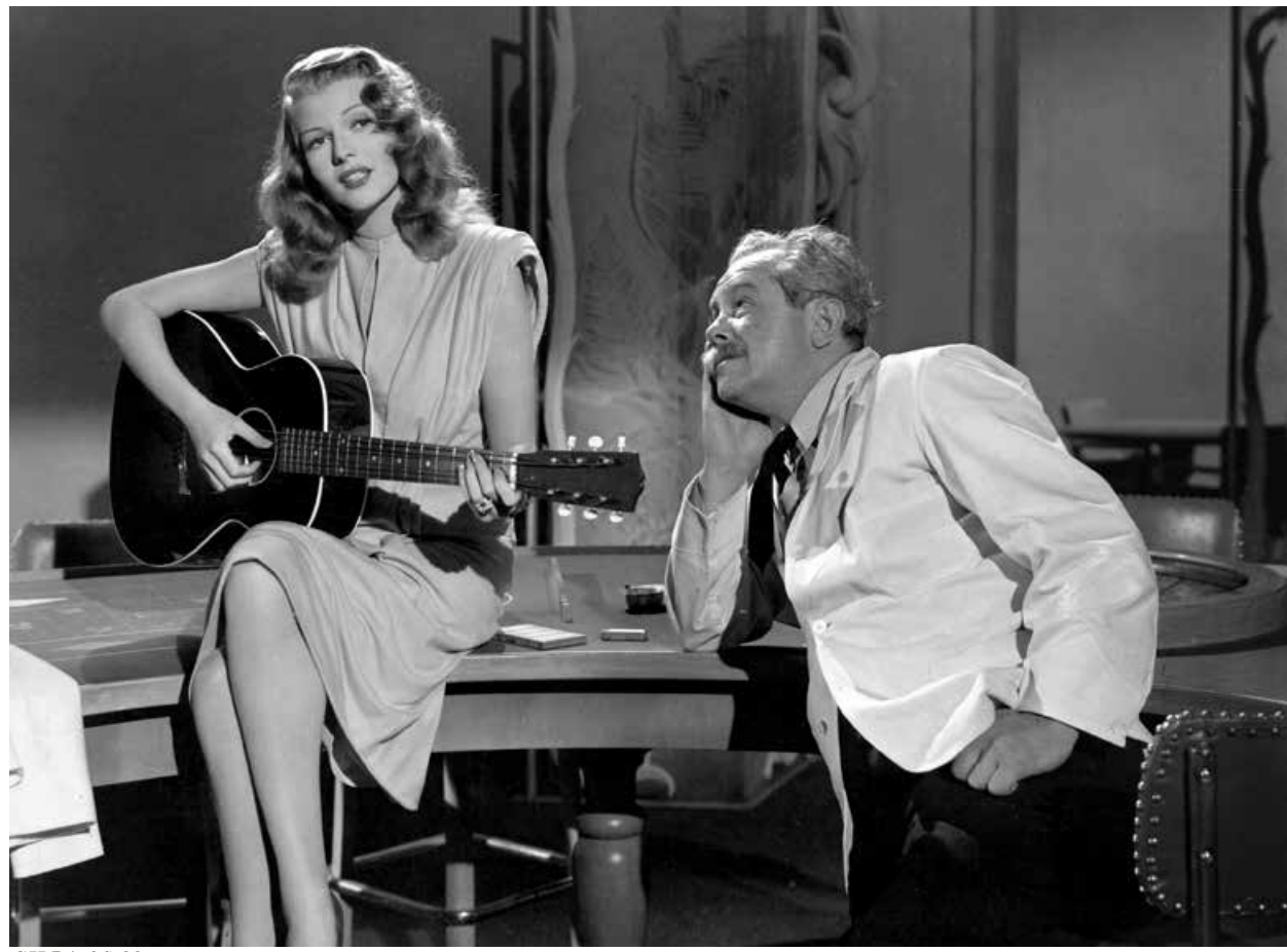
GILDA / S.23

LANDKINO IM SPUTNIK 20:15 WES ANDERSON THE ROYAL TENENBAUMS S.29 USA 2001 110 Min. Farbe. Digital HD. E/d WES ANDERSON