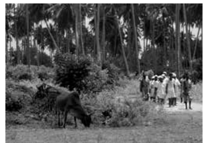
TUG OF WAR

Was würde Pina Bausch machen, wenn sie wüsste, dass das Tanzen verboten ist? In vielen Teilen der Welt ist das Tanzen ein Symbol der Freiheit. Als Andenken an Pina Bausch und in Solidarität mit den Menschen weltweit, denen das Tanzen verboten ist, laden wir herzlich zu einer Performance in Begleitung der deutsch-persischen Schauspielerin und Sängerin Atina Tabé ein. Wir setzen ein künstlerisches Zeichen und schützen die Räume der Freiheit. Die Performance ist kein angeleiteter Tanz – unsere Choreografie ist die Freiheit. Alle können mittanzen! Eintritt frei